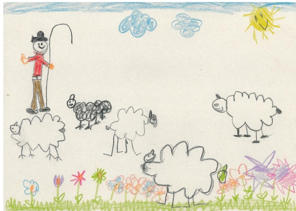
Das Bild hat ein Kind aus unserem Kindergarten gemalt.

Wir brauchen einen Hirten. Wir brauchen einen Hirten, der sich um uns kümmert und uns führt. Es gibt ihn. Er ist ein Hirte, der uns mit Namen kennt.