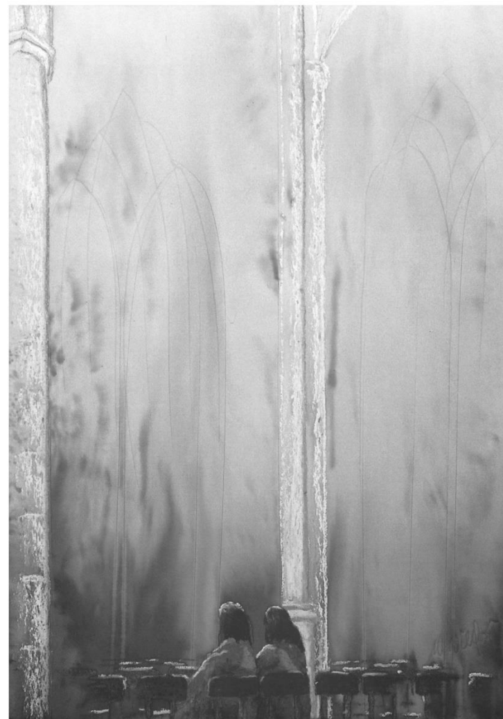
Bild: spirituelle Kunst von Michael Willfort, Galerie: www.kunst2day.de

Wo es finster bestellt ist in uns selbst, in der Kirche und in dieser Welt, sehnen wir uns nach dem Licht. Wo alles verhärtet ist in Hass und Kälte, sehnen wir uns nach Liebe und Wärme. Wir brauchen Gottes Geist in uns selbst, in der Kirche, in der Welt. Wir brauchen Pfingsten.